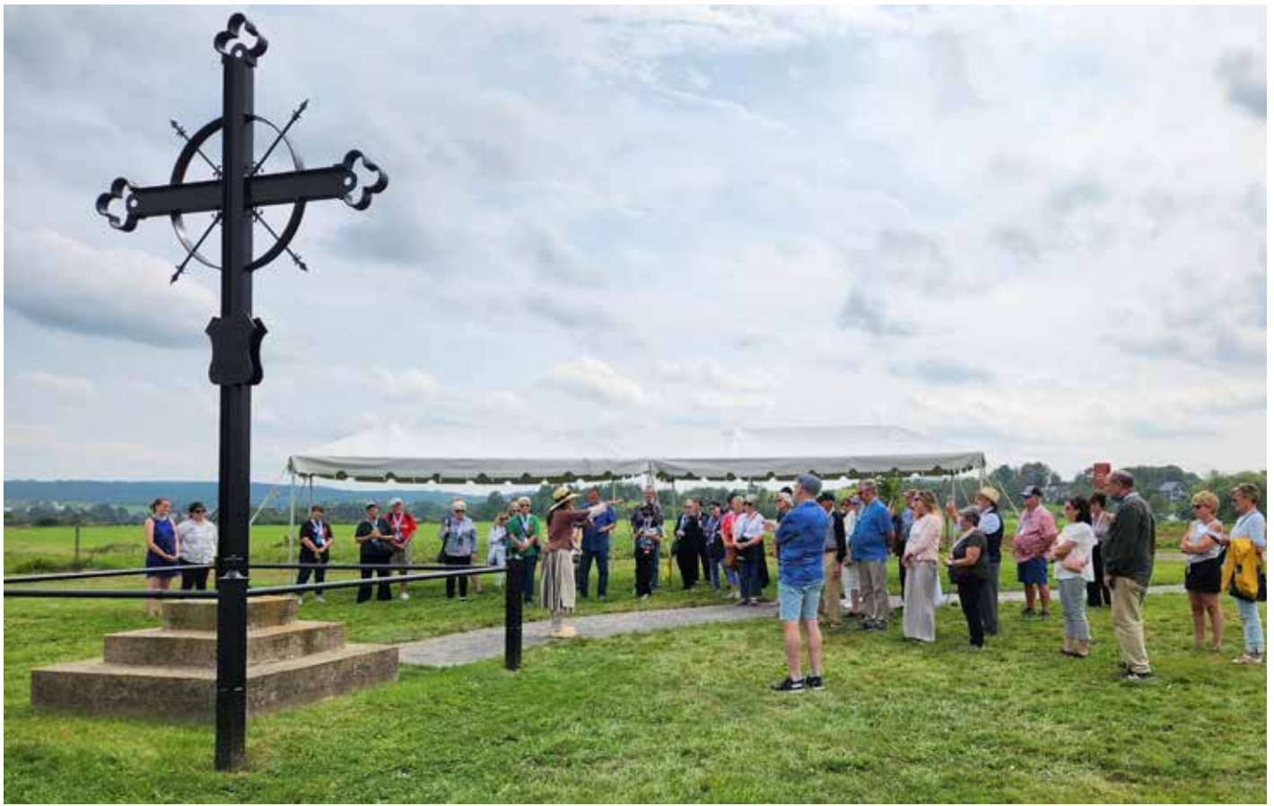
Commémoration du 100e anniversaire de la Croix de la Déportation